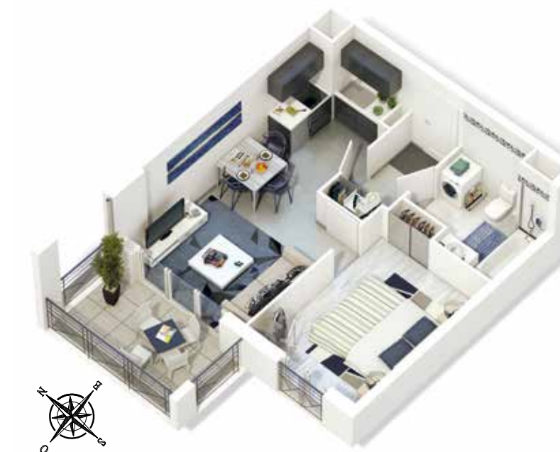
Exemple d'appartement 2 pièces, lot n° JdG A201 Surface de 37,2m² et 6,2 m² de terrasse