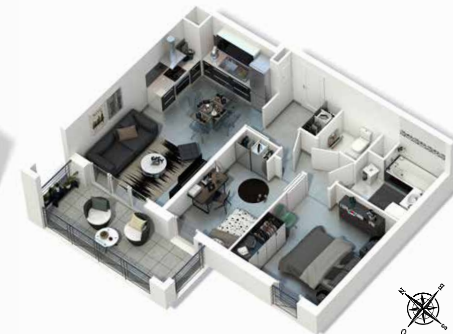
Appartement 3 pièces, lot n° Ods A204 Surface de 54,4m² et 9,4 m² de balcon